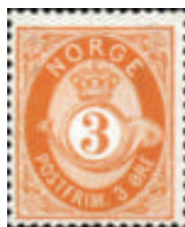
nr. 23, uitgegeven op 1/1/1877

de aanduiden 7 De vrije ruimte binnen de lijst vertoont verticale strepen.