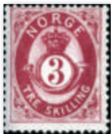
nr. 18, uitgegeven op 7/1/1872