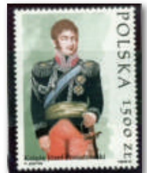
Generaal Poniatowski, Maarschalk van Frankrijk en aanvoerder van het Poolse leger van Napoleon

De Heilige Stoel verklaarde ooit dat een Heilige Mis bijwonnen in de kathedraal een ziel uit het vagevuur bevrijdt. Er is echter geen viering in het verschie, dus spoeden we ons naar buiten en starten de beklimming van de belforttoren naast de Wavel-kerk om de "Zygmunt" klok