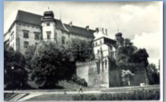
De oostelijke zijde van het kasteel