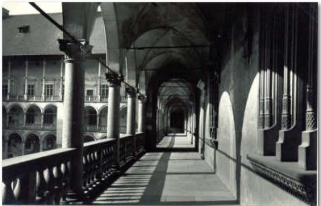
Het prachtige binnenplein met zijn arcaden