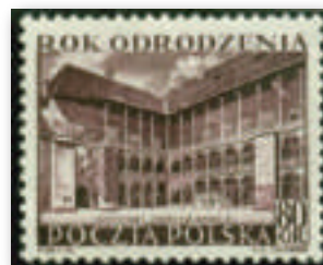
Het prachtige binnenplein met zijn arcaden vinden we op twee postzegeluitgiften terug